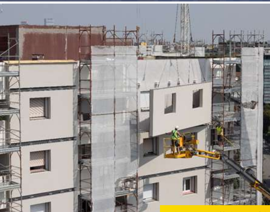
Izolare cu panouri izolante prefabricate realizate din subproduse din orez

Proiectele de arhitectură Ricehouse, în care subprodusele rezultate din cultivarea orezului au fost utilizate ca material izolant durabil pentru clădiri, au dus la următoarele emisii de CO 2 sechestrate în perioada 2021-2023: 11